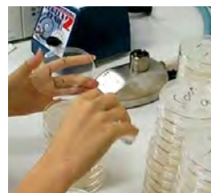
突然変異原性試験 (エイムス法)