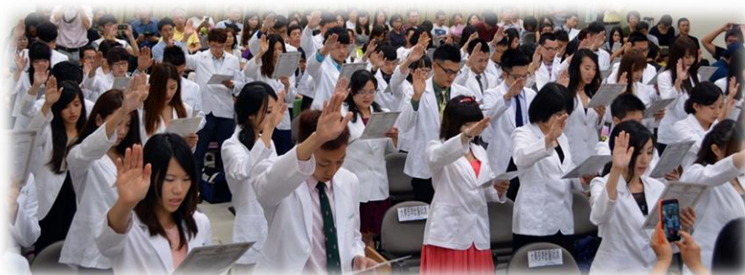
▲授服典禮宣誓實況

有人回憶起剛入學的天真與單純——為準備解剖考試而沒日沒夜地背骨頭，抑或因龐雜繁重的考試犧牲睡眠時間，千求萬求只求就此通過；也