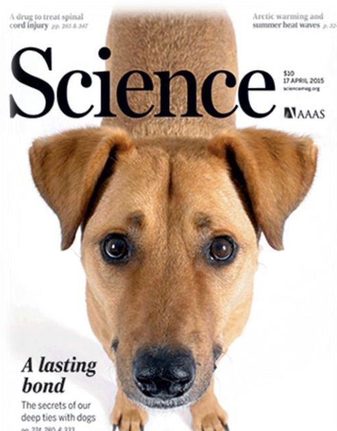
▲今年 4 月 17 日出版的《Science》封面為正在凝視飼主的狗。人類與其飼養的狗會互相凝視，如同人類對待嬰兒。現有考古學家與遺傳學家共同合作以了解這種特殊關係的建立機制。麻布大學的團隊探討荷爾蒙如何影響人狗關係的建立。

麻布大學是一所私立學校，已有 126 年歷史，只有兩個學院，學生三千多人，主要收入是學生的學費。師生不多，但是卻很認真實際地教學與研究，今年四月《Science》的封面就呈現了麻大的研究成果。