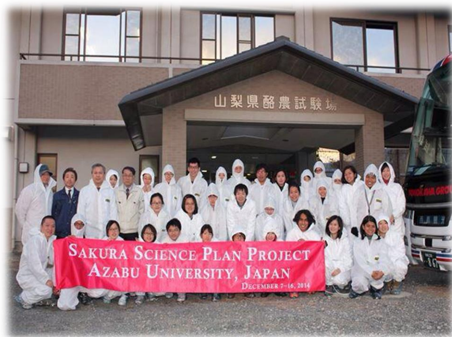
▲實際去參訪日本山梨縣酪農試驗場

堂的一開始，老師們紛紛發下不同的外寄生蟲標本、一張非常大的空白海報紙以及各色海報筆給各小組，接下來老師們就讓我們每組自由發揮，讓我們從一開始鑑定這些外寄生蟲為何種種類，再來這些外寄生蟲又各自讓你們想到什麼，到最後請以組為單位，將這些資訊串連在一起，並告訴其他學員你們的發現，在課堂中每位學員發揮自己的專長，有些人專攻寄生蟲、細菌或是病毒的基礎研究、有些人是已經執業的臨床獸醫師，每個人提出不同的看法，從外寄生蟲的生活史、可攜帶之病原、能傳播之疾病到如何治療與預防，雖然每組的報告都不盡相同，但我們每組都組成了一個非常完整的 whole picture！透過這次的課程，除了學習到各式不同的傳染病的相關知識外，更讓我結識到不同領域、不同國家的專業人才。