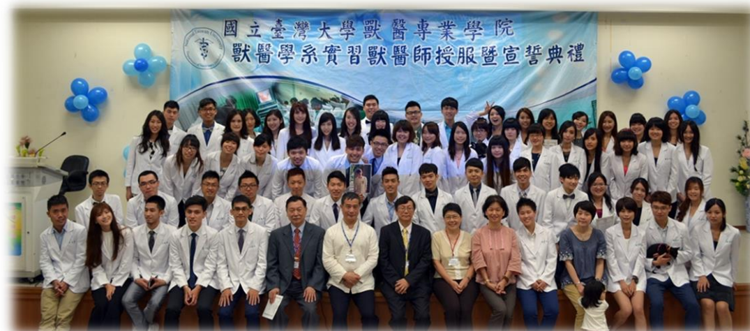
▲全體參與師生合影留念

「當我選擇獸醫學作為我一生的志業並站在這神聖殿堂的此刻……」，在朗朗響起的宣誓聲中，一群背負著生命責任的准獸醫師，正用最誠摯的心，貫徹甫入學時那溫柔又沉重的初衷。