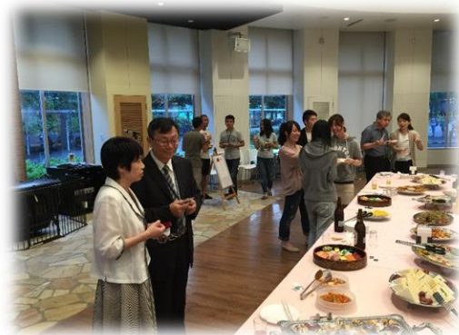
▲welcome party 實況

六月中，臺大獸醫專業學院選派了四名研究生與醫師至日本麻布大學交流實習兩週。麻大非常重視與臺大的交流，兩校簽有合作備忘錄，麻大提供的行前準備非常充足，因此我就利用學期末的空檔，至麻大兩天，實地眼觀耳聞交流的情形。由於臺灣金門有口蹄疫發生，麻大要求行前一週避免到牧場接觸偶蹄動物，到了日本 24 小時後才得以進入動物診療場所，顯示他們嚴謹執著的一面，也讓我憶起日本過去幾次的口蹄疫總能在三個月內就撲滅，OIE 隨即公告非疫區國的情形，值得臺灣防疫人員好好學習。