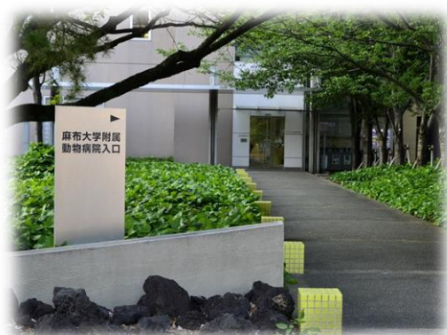
▲麻布大學教學醫院入口