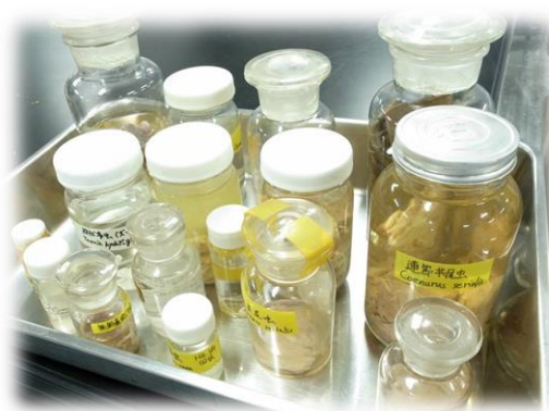
▲寄生蟲學使用標本

學生所使用的實習教材可看得出所費不貲，許多科目都是使用真實機器及實驗用狗讓學生親自操作。在某些科目上，實際操作的學習成效的確比書面教學要好上許多。大動物的實習操作也不少於小動物，有機會讓更多的學生激發出對大動物或經濟動物的興趣。臺灣的獸醫分布不均，或許可在課程上做改善，讓更多學生接觸大動物醫療，並改變臺灣獸醫現所面臨之窘況，朝向更美好的未來邁進。