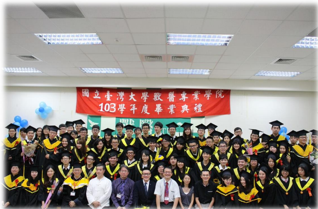
▲全體參與師生合影留念