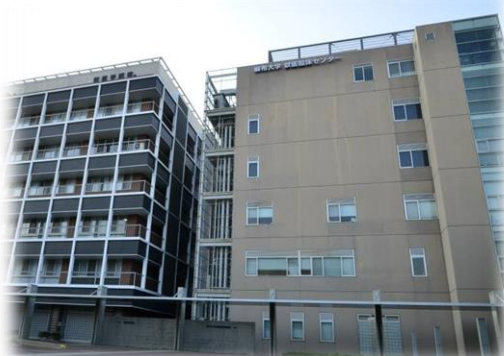
▲麻布大學教學醫院及獸醫系館

今年 6 月 13 日至 27 日，與其他 3 位臺大獸醫的學生，一同至麻布大學交流學習。麻布大學位於神奈川縣相模原市淵野邊，離電車車站約 15 分鐘路程。佔地 11 公頃的麻布大學只有兩個學院，分別是獸醫學院，以及生命環境科學院。自 1894 年就成立的麻布獸醫學校，在 1947 年遷至現今神奈川縣的校區，直至今日我們拜訪，校園