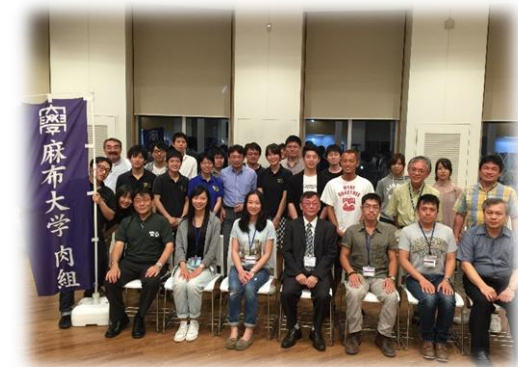
▲全體與會者合影留念