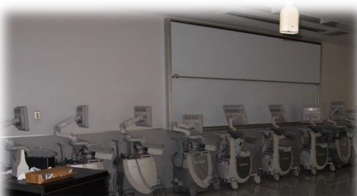
▲學生實習課程用超音波