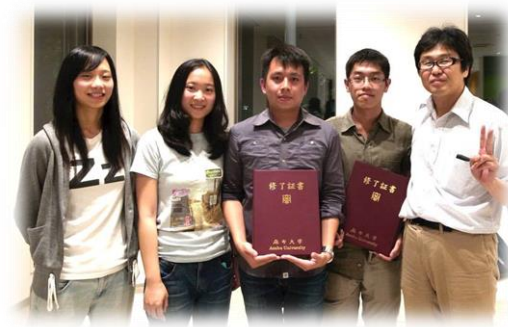
▲結業式與內科教授合影

這次除了在臨床上的知識有所斬獲，更與日本的教授、獸醫師、同學建立起深厚的友誼，常在一日門診結束後一起到居酒屋、迴轉壽司店共進晚餐、把酒言歡，非常感謝所有對我們的熱情招待。這次的日本行也趁著在週末的空閒時間，遊覽了東京都許多著名的景點、嘗了許多道地的日本美食，學習之餘也不忘享受這次的日本之旅，也希望日後臺大與麻布大的交流能一直持續，激發出更多合作的可能。