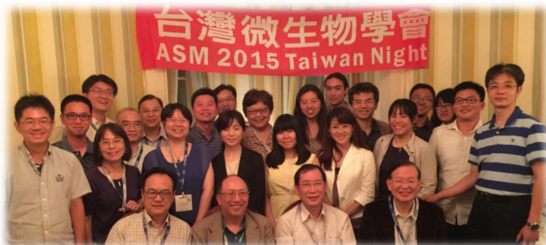
▲5/31 台灣微生物學會於 Commander's Palace 餐廳晚宴

星期三踏上了歸途，很高興參加 ASM2015，學了很多東西，更重要的是，知道世界真的很廣闊！