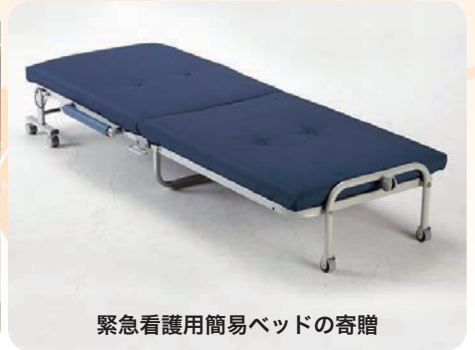
緊急看護用簡易ベッドの寄贈