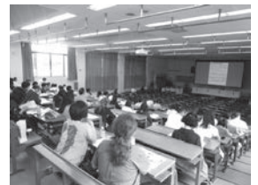
▲キャリア・就職セミナー

今年度は179組232人の御父母の参加により、無事に定期総会を終えることができました。御来場いただいた御父母をはじめ、御協力いただきましたみなさまへ感謝申し上げます。研究室訪問は、普段見ることのできない御子女の研究室での様子を御覧いただくと同時に、研究室の指導教員から、御子女の研究室活動等について説明を受けられました。